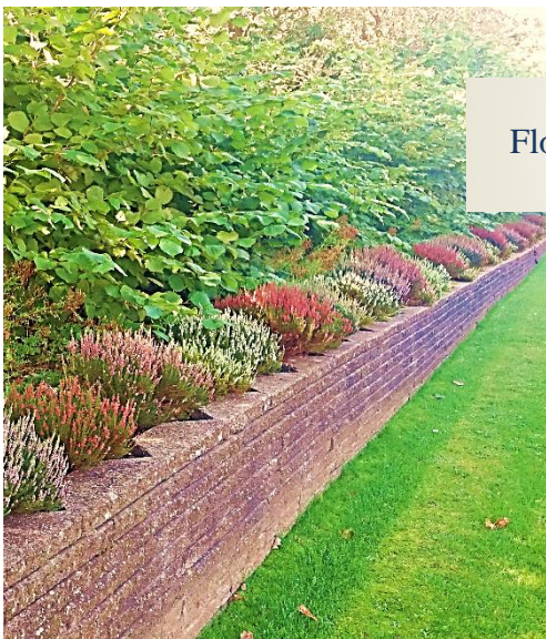
Flotte farver i afd. 3 og afd. 10