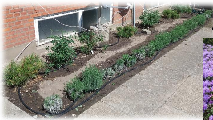
Der vandes med siveslange i det tørre forår

På viceværftfronten er vi kommet igennem en nem vinter, hvor de er blevet skånet for en masse snerydning. Til gengæld måtte de i gang med at vande pga. et tørt forår. Miljøet er stadig i fokus, hvor der bruges minimalt af sprøjtegifte og vælges farverige planter, der kan bidrage med nektar og pollen til insekterne.