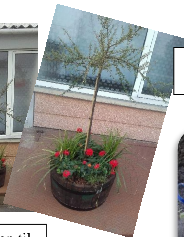
En farverig balje med blomster på Kærdalen