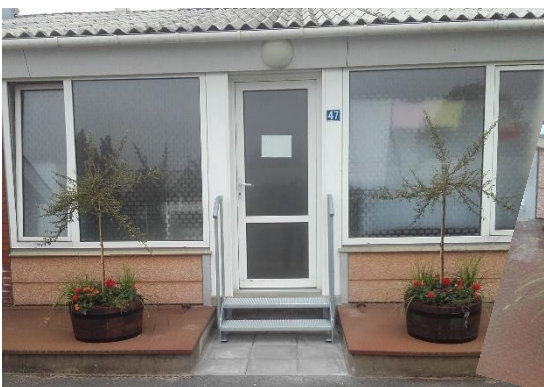
Afdeling 10 har gjort indgangen til deres vaskeri indbydende med nye blomsterkummer

På flere afdelingsmøder har beboerne talt om manglende vedligehold af haverne. Det betyder meget for områderne, at haverne og fællesområderne holdes i pæn stand, så haverne skal løbende vedligeholdes. Det betyder som minimum, at græsset slås 1-2 gange ugentligt i vækstperioden. Ukrudt i hækken fjernes løbende, således at hækken ikke ødelægges og ukrudtet ikke breder sig ind til naboen. Hækken klippes i juni/juli på alle sider, og der skal løbende ryddes op i haven.