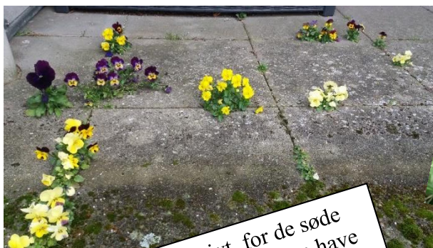
Der luges selektivt, for de søde små buketter skal da næsten have lov til at blive stående