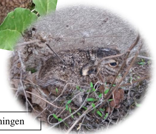
Dyr titter frem under lugningen