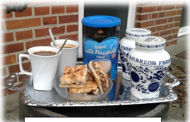
Viceværterne forkæles i afd. 13

Med disse ord vil vi slutte denne udgave af Beboer Nyt med nogle stemningsbilleder fra Vejen Boligforening.