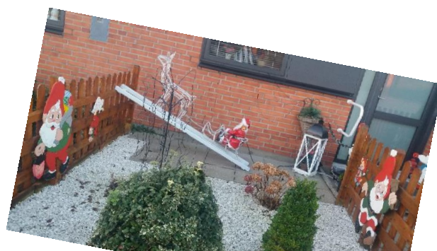
Juleudsmykning hos en beboer i afd. 15 i både dagslys og mørke