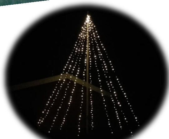
Afd. 10 har fået flagstangen pyntet i juleklæder